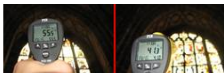
Temperaturvergleich, links eine herkömmliche Schutzverglasung, rechts unsere UV- und IR-Schutzverglasung

Beim Kaiserfenster erfolgte der Einsatz einer einscheibigen Verglasung, die auch den schwierigen Zuschnitt wie beim vorliegenden Maßwerkfenster problemlos ermöglichte.