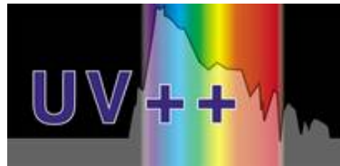
Der UV++Schutz der weiter denkt!

Nach dem Einsetzen der Schutzverglasung präsentiert sich das Kaiserfenster optisch innen sowie außen fast unverändert: Reflexion und »Durchsicht« erscheinen unverändert. Die Farbwiedergabe und die Farbbrillanz der Glasmalerei werden durch die Schutzverglasung nicht beeinträchtigt.