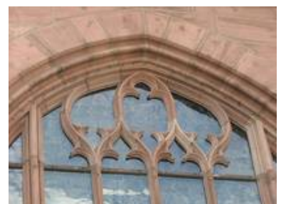
Durch den einscheibigen Aufbau sind auch komplizierte Scheibenformen wie im Maßwerk möglich.