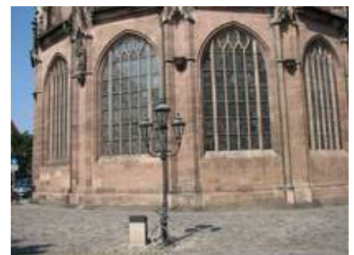
Außenansicht des Kaiserfensters (rechts) im Vergleich zu den anderen Fenstern.