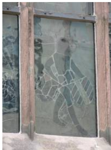
Die bewegte Glasoberfläche der Schutzscheiben wird der historischen Architektur gerecht