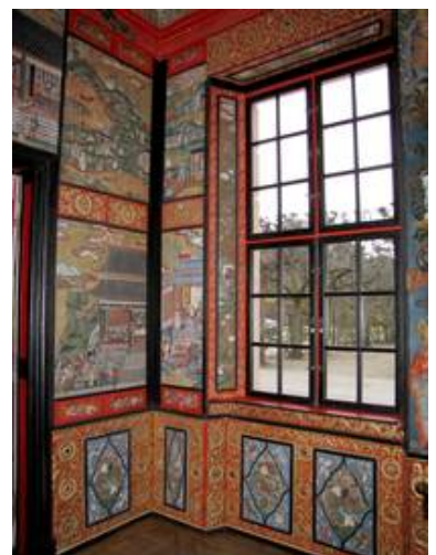
Ermitage in Bayreuth UV-Schutzverglasung in Holzfenstern.