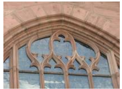
Durch den einschiebigen Aufbau sind auch komplizierte Scheibenformen wie im Maßwerk möglich.