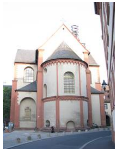
Eine völlig unauffällige Art des UV-Schutzes - vollintegriert in eine Bleiverglasung mit klassischen mundgeblasenen Antikgläsern