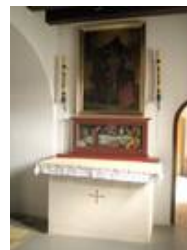
Schutzscheibe vor einem Altarrentabel, ähnliche Gläser werden auch in Vitrinen eingesetzt.