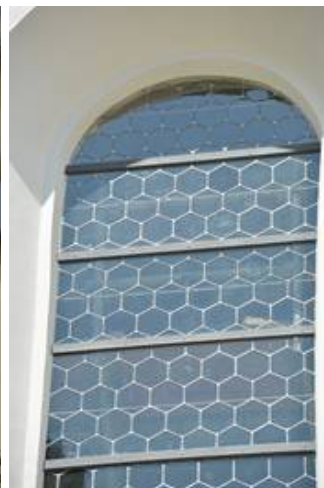
Auch in der Nahaufnahme zeigen die Chorfenster die klassische Ansicht einer Bleiverglasung