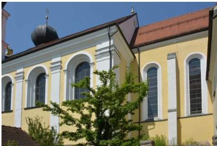
Die Schiffenster (links) unterscheiden sich von außen nicht von den beiden UV-schützenden Chorfenstern (rechts)