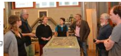
Die Schlußbesprechung mit Vorstellung des Ergebnisses