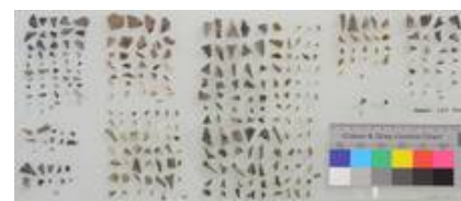
Einige Glasfragmente nach der farblichen Vorsortierung