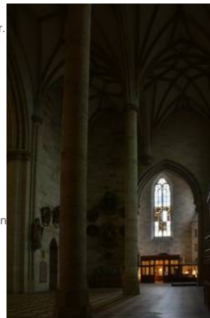
Das Kutteltürfenster vom nördlichen Seitenschiff aus gesehen

...Da Klebung und Stabilisierung nicht parallel ablaufen konnten, musste die Stabilisierung in