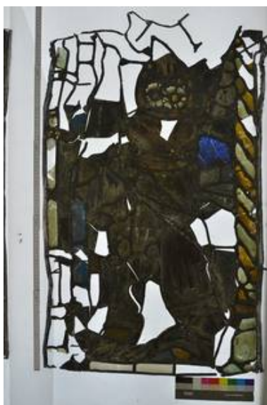
Feld 4c im VZ DL IS (nach der Bergung aus dem Münster)

Im Jahr 2008 fielen die zwei Glasfelder 4c und 5c mit der Darstellung der Heilige Dorothea aus dem Fenster.