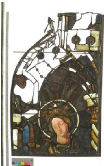
Feld 5c im VZ DL IS (nach der Bergung aus dem Münster)