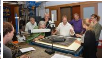
Besprechungen mit dem Fachgremium sind ein wichtiger Meilenstein der Maßnahmen