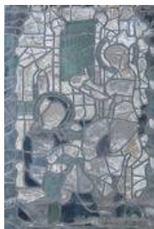
SII 10d Außenseite im