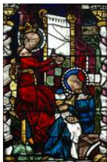
SII 10d Innenseite im