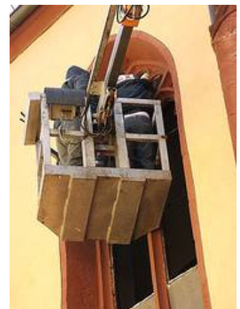
Der Ausbau erfolgte vom Hubsteiger aus.