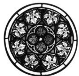
16. Rosette mit Weinlaub. Frankfurt, Historisches Museum Nr. 11, - Kat. S. 106.