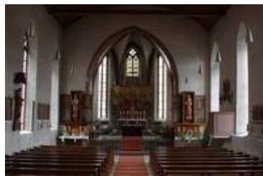
Der Innenraum der Kirche mit dem Chorscheitelfenster

Die Scheiben sind vorzüglich erhalten. Es sind äußerst wenige, zum Teil noch mittelalterliche Ergänzungen zu verzeichnen. Die Scheiben haben auch ihr ursprüngliches, mittelalterliches Bleinetz bewahrt, was sehr selten ist.