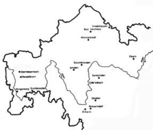
Übersicht der mittelalterlichen Glasmalereien in Unterfranken (in situ)