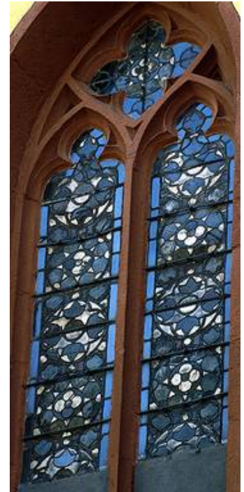
Im Vorzustand war erkennbar, das auf Grund fehlender Deckschienen und starker Durchbiegung akuter Handlungsbedarf besteht.