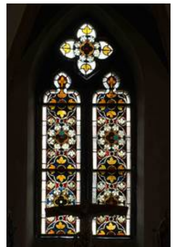
Das Fenster im Nachzustand von Innen