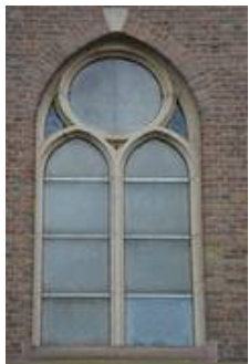
nVII im Vorzustand, die Glasmalereien sind durch die Acrylglasscheiben nicht zu erkennen