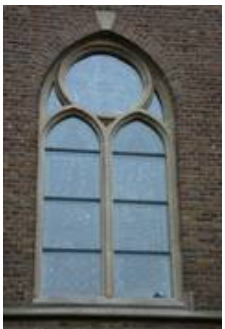
nVII im Nachzustand, auch durch die Schutzscheiben sieht man den Glasmalereischatz