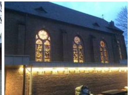
Gerade Nachts bei Beleuchtung setzen die Glasmalereien jetzt ein besonderes Zeichen