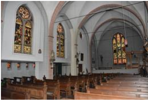
Blick ins Kirchenschiff, nach Westen, VZ

Die Werkstätte in der die Glasmalereien ursprünglich gefertigt wurde ist leider nicht bekannt, auch da die Scheiben nicht signiert wurden. Der Malstil gibt jedoch Anlaß zur Vermutung, dass die Scheiben aus dem Atelier Clayton & Bell stammen könnten, die ab den 1870ern bis ins 20. Jahrhundert Glasmalereien fertigten.