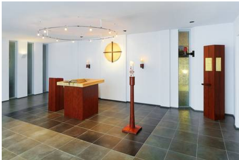
Sandstrahlung mittels Fototransfertechnik nach Entwürfen von Karls Decker für die Hauskapelle im Caritas-Altenzentrum Kardinal-Frings-Haus in Köln, Fotografen: Perlbach-Fotodesign, Preetz