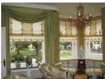
Passend zur Farbstimmung im Raum wurde die Sandstrahlung