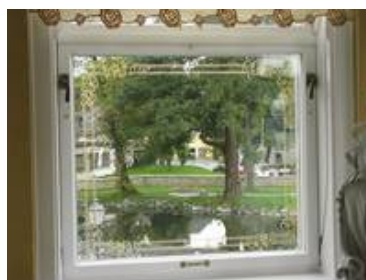
hier in einem sanften gelb eingefärbt.