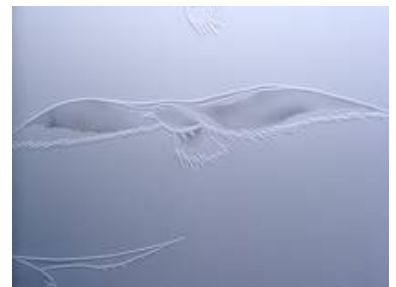
Sandstrahlarbeit matt in matt für ein Privathaus in der Türkei