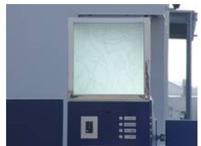
Tiefstrahlarbeit matt in matt für eine Leuchte eines Firmentores