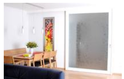
Eine Sandgestrahlte Türscheibe (Sicherheitsglas) in Kombination mit einem Schmelzglasbild in einem Lichtrahmen