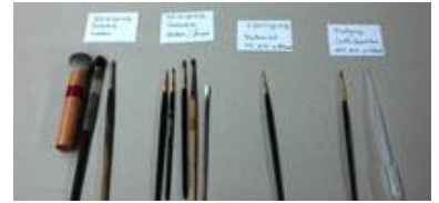
Behutsame, feine Werkzeuge sind für eine differenzierte Reinigung nötig. Dinge wie Stahlwolle oder Putztücher sind hier fehl am Platz.

Deshalb werden bei uns erst nachdem die Glasmalereien in der Werkstatt auf dem Arbeitstisch zugänglich sind, die für das spezielle Objekt nötigen Reinigungsschritte und Techniken im Rahmen einer detaillierten Werkstattbesprechung besprochen.