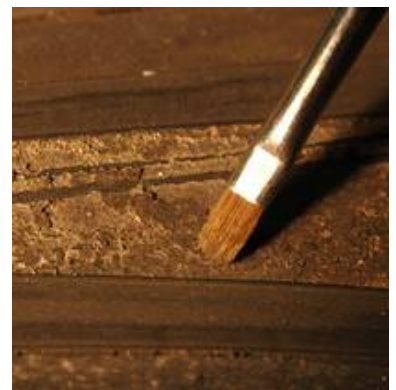
Erste vorsichtige Reinigungsprobe einer fragilen Oberfläche.