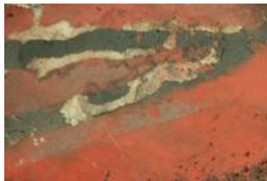
Detail der gleichen Stelle nach der Reinigung im Nachzustand.