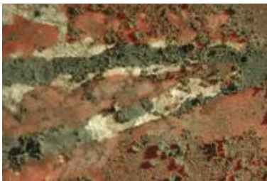
Detail einer mittelalterlichen Glasmalerei im Vorzustand.

Erste vorsichtige Reinigungsprobe einer fragilen Oberfläche.