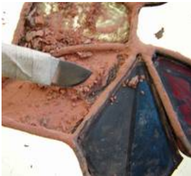
Vorsichtige Freilegung einer mittelalterlichen Bleiverglasung die mit Wandfarbe überstrichen war.