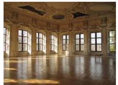
Blick in den südwestlichen Teil des Festsaal