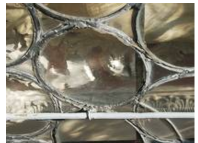
Der Vorzustand des Bleinetzes zeigt das leider nicht alle Bleie gehalten werden konnten, schließlich sollte die Dichtigkeit der Gebäudehülle wieder hergestellt werden