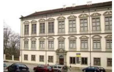
Blick auf die Südseite des Residenzschlosses, die vier großen Fenster im zweiten Stock sind Teil des Festsaal

Durch die restauratorische Überarbeitung konnte der Glasbestand gesichert, vervollständigt und die Felder hinsichtlich der Bleinetze stabilisiert werden, die nötige Abdichtung des Baukörpers wurde wieder hergestellt.