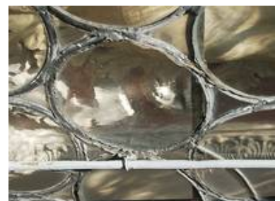
Der Vorzustand des Bleinetzes zeigt das leider nicht alle Bleie gehalten werden konnten, schließlich sollte die Dichtigkeit der Gebäudehülle wieder hergestellt werden