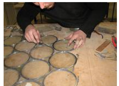
Die Arbeiten wurden vor Ort ausgeführt, was dem Bauherrn eine besonders intensive Begleitung der Arbeiten ermöglichte