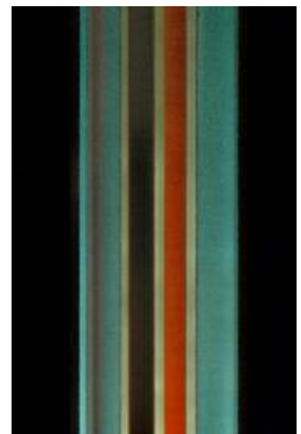
Eine Kante im Durchlicht