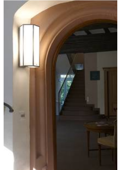
WS 09/W 14 T