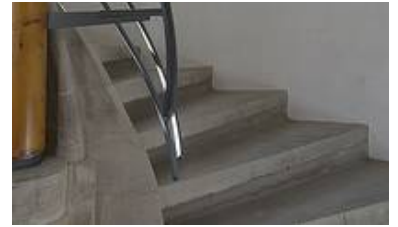
WS 09/W 10 T