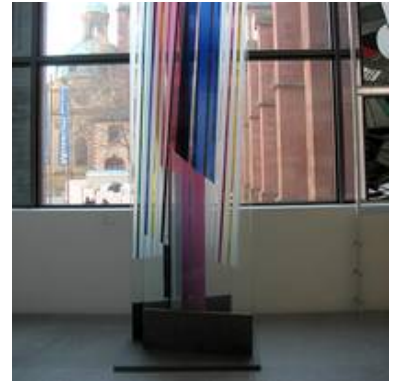
Der neue Platz der Stele von Raphael Seitz