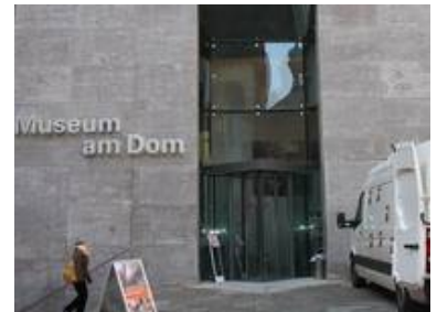
Das Museum am Dom befindet sich im 2001 bis 2003 generalsanierten und umgebauten Kilianshaus.

Dazu mussten zuerst die beiden ca. 320 cm hohen ESG Scheiben, auf denen mundgeblasene Echt-Antikgläser aufgeklebt sind, demontiert und fachgerecht zwischengelagert werden. Anschließend wurde die schwere Sockelplatte umgesetzt und schließlich die Scheiben wieder montiert.