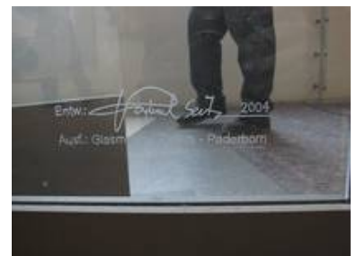
Die Stele entstand 2004