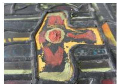
Ein zwar virtuos gemaltes, aber "nicht ganz korrektes ;-)" Ergänzungsstück