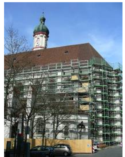
Mariä Himmelfahrt in Landsberg