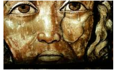
Eindruck aus einem der mittelalterlichen Glasmalereifelder