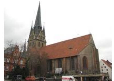
St. Nikolai zu Flensburg

Eine Baustelle größere Entfernung war bisher die Neuverglasung der Seitenschiffenster der Kathedrale von Lomé in Togo; was aber bekanntermaßen nicht mehr in Deutschland liegt ;-)