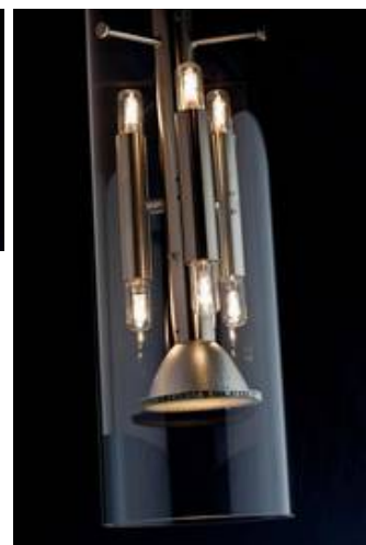
ML 04/P 2-7 mit klarem überlagem Glaszylinder und Blendraster