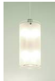
ML 04/P 2-7 in der Standardausführung

Hier finden Sie einige der jüngsten Modifikationen der ML 04/P 2-7.