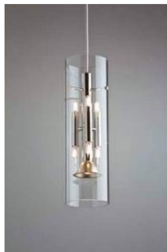
ML 04/P 2-7 mit klarem überlagem Glaszylinder

Der teilmattierte Glaszylinder hat sogar eine Höhe von 70 cm.