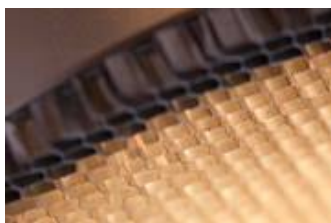
Das Blendraster kann mit verschiedenen Leuchten

Inwieweit das Raster eine Auswirkung auf die Bestückung des Downlights hat wird aktuell mit Kontrollmessungen untersucht.