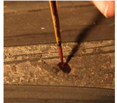
Infiltrieren von Festigungsmitteln in lockere Malschichten

Selbstverständlich werden die entsprechend behandelten Bereiche in der Dokumentation akribisch erfasst.