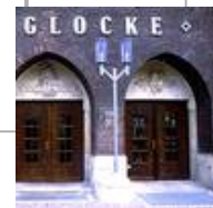
Die Glocke, Schauspielhaus, Bremen Standaußenleuchten WB 85/SL 2-1 mit Sondermast