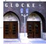
Die Glocke, Schauspielhaus, Bremen Standaußenleuchten WB 85/SL 2-1 mit Sondermast