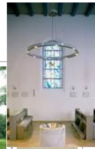
Kath. Kirche Itzehoe Halogenkronleuchter KR 94-4/H 1-50/12-12