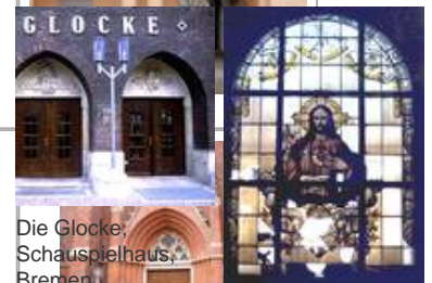
Die Glocke, Schauspielhaus, Bremen Standaußenleuchten WB 85/SL 2-1 mit Sondermast Kath. Kirche Sulzbach, sv Herz-Jesu vor der Restauration