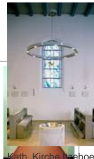
Kath. Kirche Hahoe Halogenkronleuchter KR 94-4/H 1-50/12-12