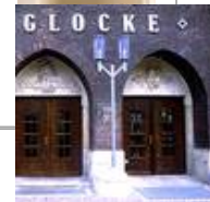
Die Glocke, Schauspielhaus, Bremen Standaußenleuchten WB 85/SL 2-1 mit Sondermast