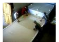
Öfen für die Glasgestaltung von bis zu 3500 x 2100 mm Brennraumfläche