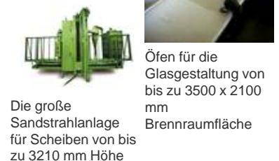
Öfen für die Glasgestaltung von bis zu 3500 x 2100 mm Brennraumfläche Die große Sandstrahlanlage für Scheiben von bis zu 3210 mm Höhe