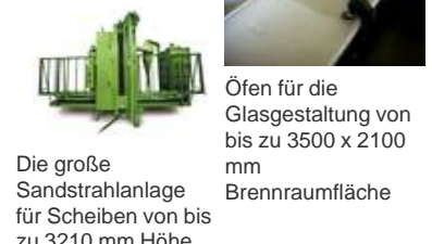
Die große Sandstrahlanlage für Scheiben von bis zu 3210 mm Höhe Öfen für die Glasgestaltung von bis zu 3500 x 2100 mm Brennraumfläche