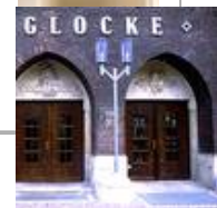
Die Glocke, Schauspielhaus, Bremen Standaußenleuchten WB 85/SL 2-1 mit Sondermast