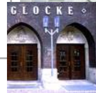
Die Glocke, Schauspielhaus, Bremen Standaußenleuchten WB 85/SL 2-1 mit Sondermast