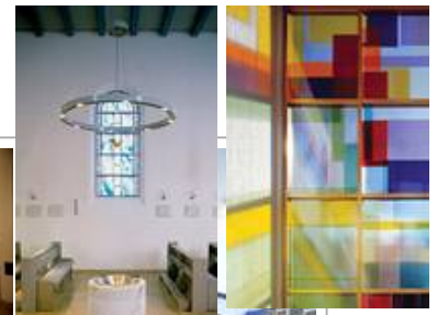
Kath. Kirche Itzehoe Halogenkronleuchter KR 94-4/H 1-50/12-12 Landeszentralbank Meiningen Fusingfenster, Prof. Kollhoff, Prof. Federle