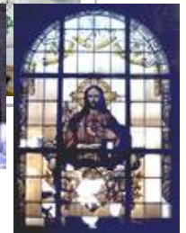
Kath. Kirche Sulzbach, sV Herz-Jesu vor der Restauration