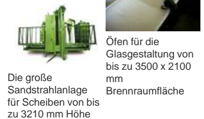
Öfen für die Glasgestaltung von bis zu 3500 x 2100 mm Brennraumfläche Die große Sandstrahlanlage für Scheiben von bis zu 3210 mm Höhe