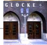
Die Glocke, Schauspielhaus, Bremen Standaußenleuchten WB 85/SL 2-1 mit Sondermast