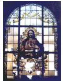
Kath. Kirche Sulzbach, sV Herz-Jesu vor der Restauration