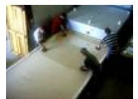
Öfen für die Glasgestaltung von bis zu 3500 x 2100 mm Brennraumfläche