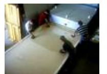
Öfen für die Glasgestaltung von bis zu 3500 x 2100 mm Brennraumfläche

Hier zeigen wir Ihnen eine Reihe von ausgeführten Projekten bei denen wir verschiedene Säle beleuchteten