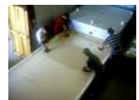
Öfen für die Glasgestaltung von bis zu 3500 x 2100 mm Brennraumfläche