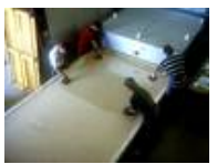
Öfen für die Glasgestaltung von bis zu 3500 x 2100 mm Brennraumfläche