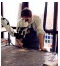
Voruntersuchung am Mikroskop