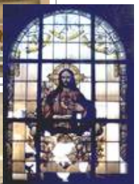
Kath. Kirche Sulzbach, sv Herz-Jesu vor der Restaurierung