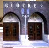
Die Glocke, Schauspielhaus, Bremen Standardaußenleuchten VB 85/SL 2-1 Sondermast