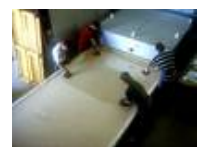
Öfen für die Glasgestaltung von bis zu 3500 x 2100 mm Brennraumfläche