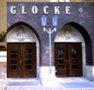
Die Glocke, Schauspielhaus, Bremen Standardaußenleuchten VB 85/SL 2-1 Sondermast