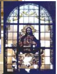
Kath. Kirche Sulzbach, sv Herz-Jesu vor der Restauration