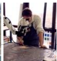
Voruntersuchung am Mikroskop