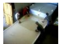
Öfen für die Glasgestaltung von bis zu 3500 x 2100 mm Brennraumfläche