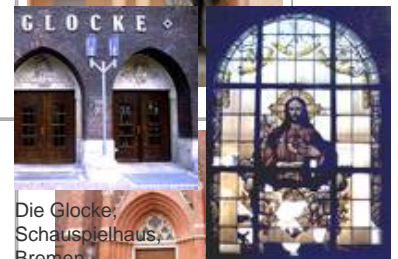
Die Glocke, Schauspielhaus, Bremen Kath. Kirche WB 85/SL 2-1 mit Sulzbach, sv Sondernast Herz-Jesu vor der Restauration