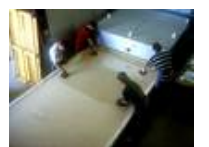
Öfen für die Glasgestaltung von bis zu 3500 x 2100 mm Brennraumfläche

Hier zeigen wir Ihnen eine Reihe von ausgeführten Projekten bei denen wir verschiedene Säle beleuchteten