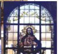
Die Glocke, Schauspielhaus, Bremen Standardleuchte WB 85/SL 2-1 mit Sondermast Kath. Kirche Sülzberger SV Herz-Jesu vor der Restauration