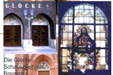
Die Glocke, Schauspielhaus, Bremen Standaußenleuchten WB 85/SL 2-1 mit Sondermast Kath. Kirche Sulzbach, sV Herz-Jesu vor der Restauration