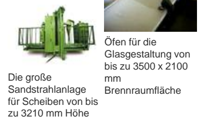
Die große Sandstrahlanlage für Scheiben von bis zu 3210 mm Höhe Öfen für die Glasgestaltung von bis zu 3500 x 2100 mm Brennraumfläche