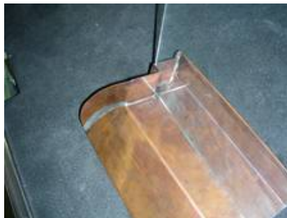
Abbildung einer Schwitzwasserrinne aus Kupfer an der die exakte Anpassung an das Mauerwerk gut zu erkennen ist.