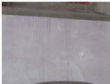
Ablaufspuren unter einem Kirchenfenster

Ein weiterer wichtiger und oft, gerade aus gestalterischen Gründen bewußt vernachlässigter Punkt ist, eine ausreichend hohe und in der Körnung richtige Kiesschüttung.