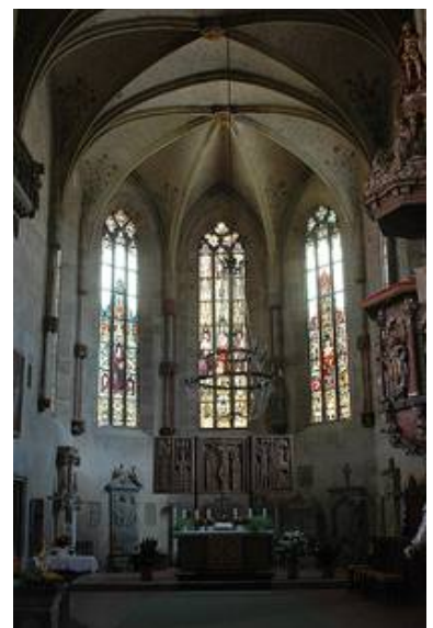
Der Chor von innen nach den Arbeiten