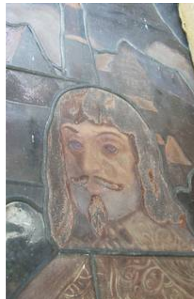
Diese Aufnahme der Malschichten läßt die Bedeutung einer Außenschutzverglasung nach dem derzeitigem Stand der Technik erahnen