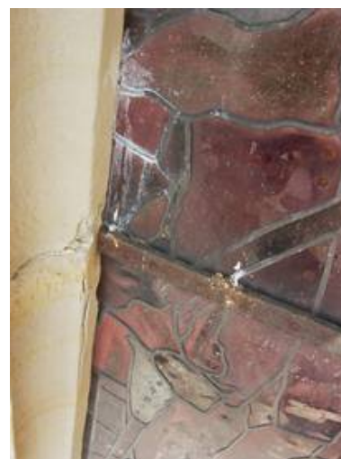
Auch der zunehmende Rostdruck durch die Eisen und die Schäden am Sandstein machten einen Ausbau der Glasmalereien dringend nötig

Dadurch sind die schutzverglasten Scheiben „bewegt“ und passen besser zu diesem historischen Gebäude als blanke und glatte normale Scheiben wie man sie z.B. in Schaufenstern einsetzt.