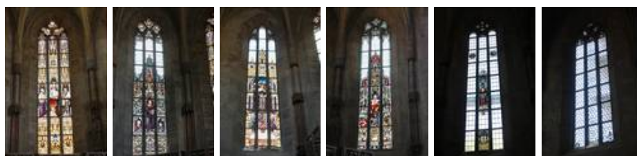
ol nll nlll sll slll slV