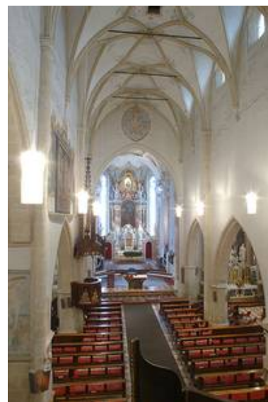
Lienz (A) - kath. Kirche St. Andrä