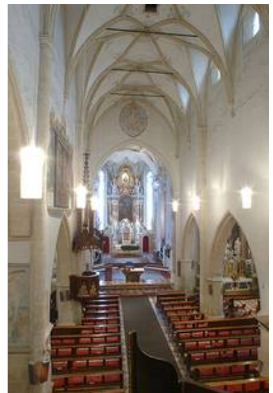
Lienz (A) - kath. Kirche St. Andrä