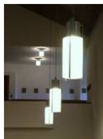
Essen - Kapelle im Franziskushaus