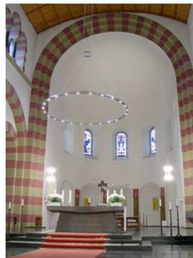
Köln - St. Michael

Weitere Informationen zum Thema sinnvolle Beleuchtung finden Sie auch im Bereich Lichtplanung .