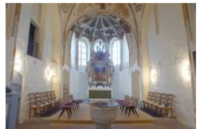
Hankensbüttel - evang.-luth. Kirche St. Pankratius