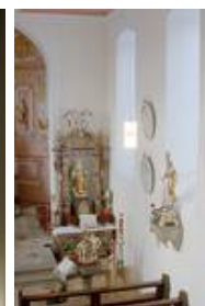
Gernach - kath. Kirche St. Ägidius