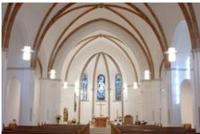
Deißlingen-Lauffen, Kath. Kirche St. Georg