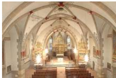
Poschiavo (CH) kath. Kirche