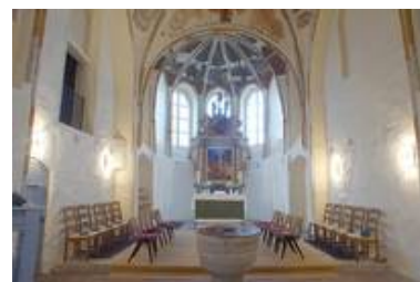
Hankensbüttel - evang.-luth. Kirche St. Pankratius