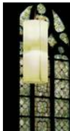
Halle, Michaelskapelle auf der Moritzburg