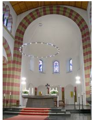
Köln - St. Michael

Weitere Informationen zum Thema sinnvolle Beleuchtung finden Sie auch im Bereich Lichtplanung .