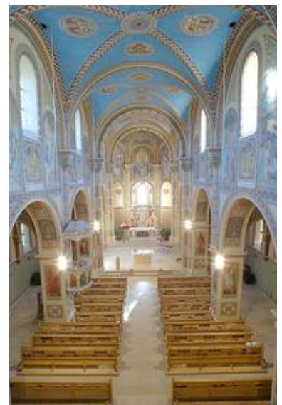
Weerberg (A) - kath. Kirche

Wir bieten Ihnen neben der Beratung, basierend auf unserer Erfahrung, individuelle Lichtplanungen und -berechnungen und gehen auf Ihre Wünsche und Anforderungen ein.