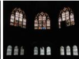
Die westliche Empore mit den Fenstern "Jesus und die Samariterin am Brunnen", "Jesus der Kinderfreund" und "Jesus - Heiland der Kranken und Armen"