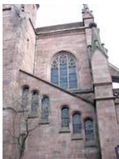
Auch die insgesamt vier Treppenhäuser sind mit einer großen Zahl von Fenstern ausgestattet