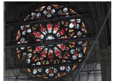
Die Gerüststockwerke verdeutlichen die Mächtigkeit der Südrossette

Die Christuskirche wurde im Verlauf des 2. Weltkrieges, in der Bombennacht vom 2./3. September 1942 beim Großangriff auf Karlsruhe und vom 4./5. Dezember 1944 bei einem erneuten Luftangriff schwer beschädigt. Hierbei kam es neben großen Schäden an Fenstern und Gewölben zu Schäden an der Rosette des Fronteingangs. Sofort nach Ende des Krieges begann man mit dem Wiederaufbau der Kirche. 1984 wurde der Wiederaufbau des ursprünglichen Turmhelms beschlossen, im September 1985 war dies dann realisiert.