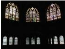
Die östliche Empore mit den Fenstern "Moses auf dem Berg Nebo", "Elias der Prophet" und "Jeremias auf den Trümmern Jerusalems"