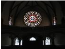
Die südliche Empore mit der mächtigen Rosette Ø ca. 6,6 Meter, den beiden seitlichen Emporenfenstern von Feuerstein; auch die drei Fenster unter dieser Empore wurden von ihm gestaltet