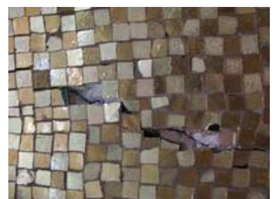
Risse im Mauerwerk führten zu einer Beschädigung des Mosaiks und zu einem Abplatzen der ca. 6x6mm aus blau-grünem Grundglas mit aufgelegtem Blattgold und überschmolzenem Deckglas gefertigten Steinchen