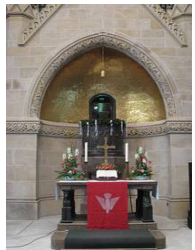
Die Altarapsis ist halbrund gewölbt und vollständig mit Goldmosaik ausgekleidet