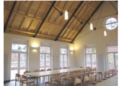
Manufakturleuchten WM 09/P 1 T und WM 94/W 3-2 T im Gemeindesaal in Wenigumstadt

Weitere Informationen zum Thema sinnvolle Beleuchtung finden Sie auch in den Bereichen energieeffiziente Beleuchtung und Lichtplanung .