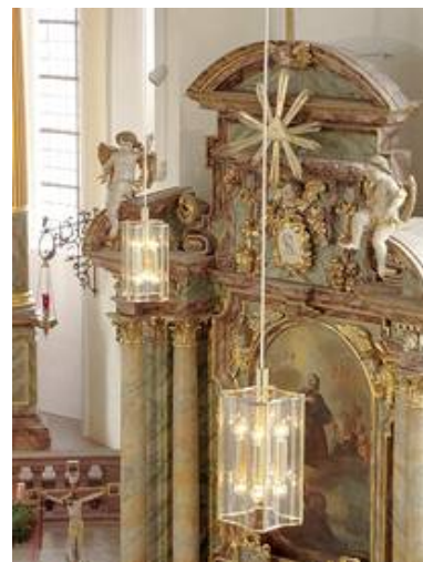
Würzburger Bleileuchten WB 07/P 2-9 hier in Messing in der kath. Kirche Weilbach