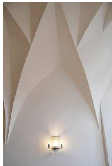
Mit zusätzlichen hocheffizientem Strahler weiterentwickelte Wandleuchte WM 03/W 1T-2 g in der Dompropstei zu Meissen