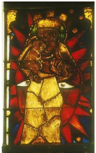
Die Innenseite im Durchlicht der Glasmalerei läßt die Abdunklung durch die Verbräunung erkennen.