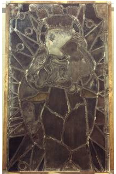
Die Aussenseite der mittelalterlichen Darstellung der Strahlenkranzmadonna im Auflicht zeigt die für mittelalterliche Gläser typischen Korrosionsprodukte.

Weitere Informationen erteilen wir Ihnen gerne auf Anfrage.